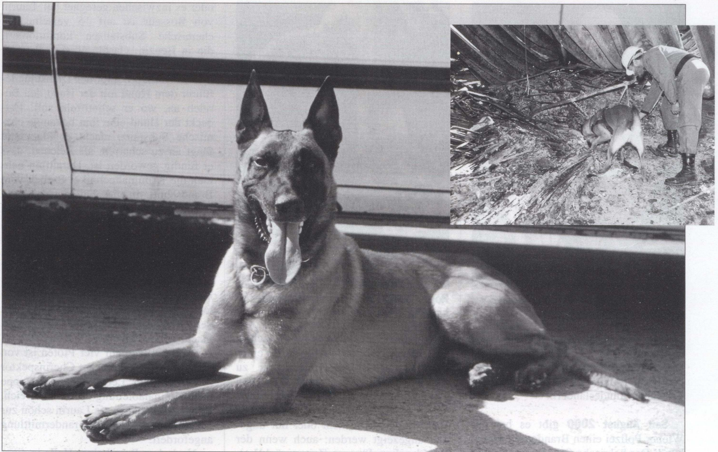
Brandquellenspürhunde „Laurin Le Bosseur“ und „Canis vom unteren Niederrhein“ (beim Schnüffeln nach Brandbeschleuniger, kleines Bild): „Nützliches Glied in der Ermittlungskette“.